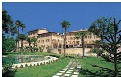
HOTEL IL CASALE