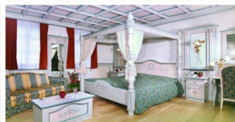
Quote a persona a settimana in camera classic in mezza pensione