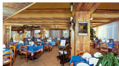
Quote a persona a settimana in camera classic in mezza pensione